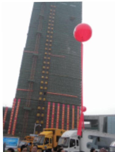
5 つ星ホテルを 2 軒建設中