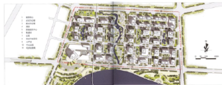
国際金融エリアを分譲開始