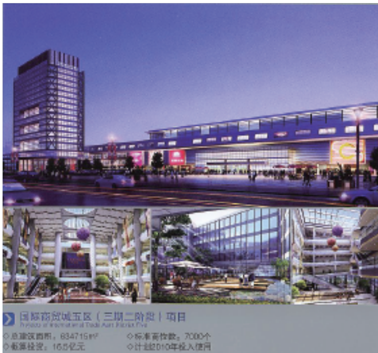
7000 軒国際展示場増設