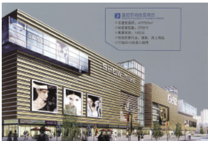
ブランド市場 6000 軒増設