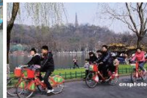
2000ヶ所に車両数を5万台